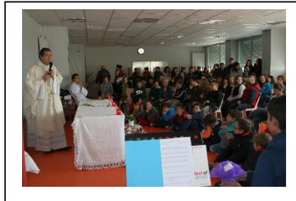
Et la messe pour les volontaires.

« Les couleurs de Noël » journée festive avec le marché de solidarité, au profit de l'association « Les amis de Fambine », qui a remporté un vif succès.